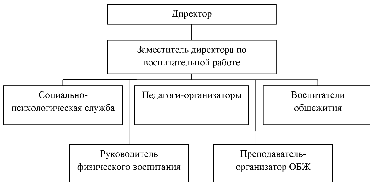
Рис. 1.1. Структура воспитательной службы КГБПОУ «Рубцовский аграрно-промышленный техникум»

служба, преподаватель – организатор ОБЖ, преподаватель-организатор физической культуры, воспитатели общежития. Возглавляет воспитательную службу заместитель директора по воспитательной работе.